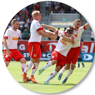
Regionalligameisterschaft 2016 und packende Relegationsspiele