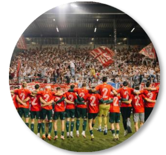
Sportlicher Neustart & direkter Wiederaufstieg