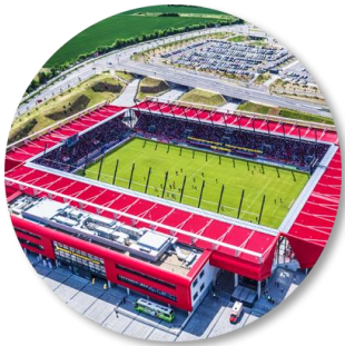
Eröffnung der Continental Arena am 18. Juli 2015

Auf die Eröffnung der damaligen Continental Arena folgen denkwürdige Aufstiegsjahre sowie sechs Spielzeiten in der 2. Bundesliga. Nach einem Jahr in der 3. Liga, in dem sich der SSV Jahn sportlich neu und zukunftsgerichtet aufgestellt hat, strebt der SSV Jahn danach, sich im Umfeld der 2. Bundesliga wieder zu etablieren.