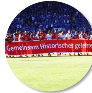
Sportlich erfolgreichste Zeit der Clubgeschichte