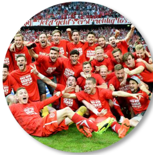
Erfolgreicher Aufstieg in die 2. Bundesliga im Mai 2017